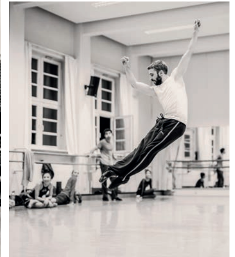
Begeisterung ohne Hemmschwelle Das Ballettzentrum Hamburg bei der Theaternacht Hamburg und beim Tag der offenen Tür