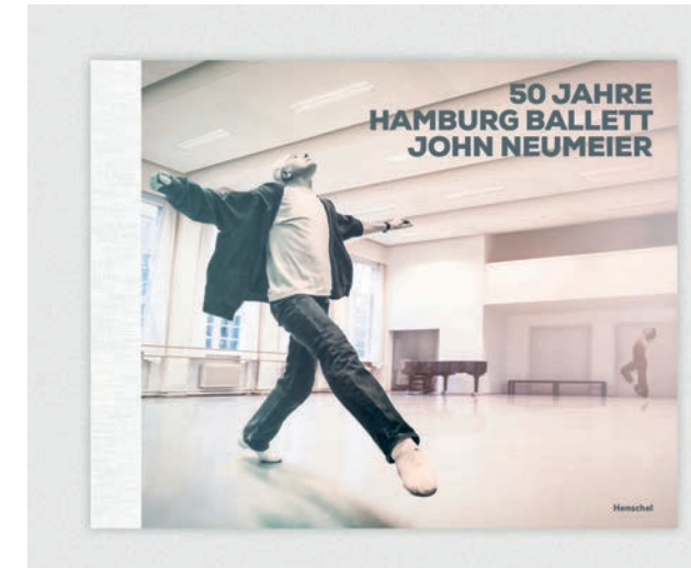
Traditionsbewusst Titelansicht zum neuen Bildband, der zur Premiere am 4.12.2022 erscheint