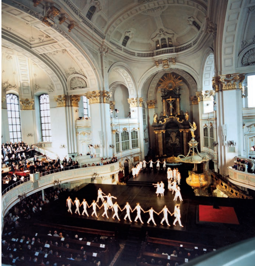
Weltoffen Aufführung von John Neumeiers Ballett Matthäus-Passion im Hamburger Michel